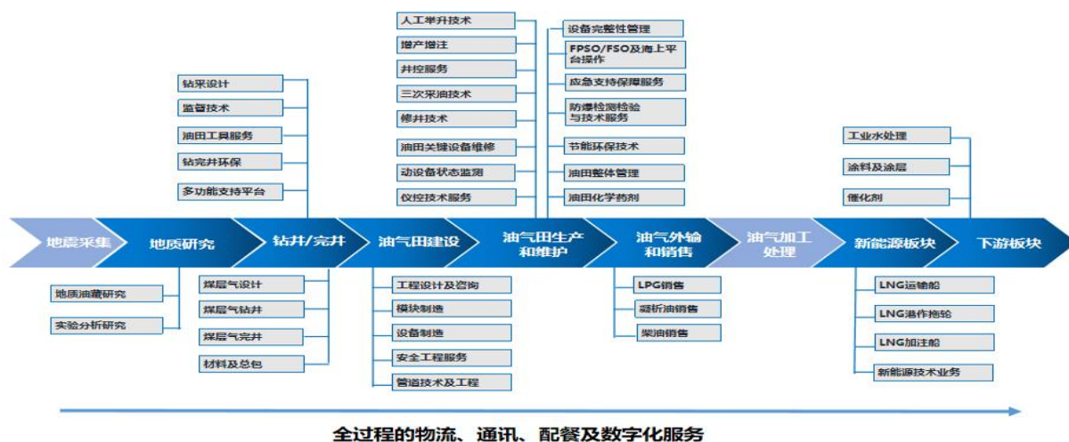
图 1：海油发展主要业务范围示意图

本报告期，公司主要围绕海洋石油生产环节，为海上油气资源的稳产增产提供技术及装备保障服务，并持续拓展陆上非常规油气田技术服务业务，同时通过物流、销售、配餐等能源物流服务提供全方位综合性生产及销售支持。公司抓住能源转型大势，瞄准“双碳”目标，以数字化为抓手，加快推进绿色转型和数字化产业发展。公司以技术服务支持生产，以产品带动技术服务，以物流服务联通技术服务与产品销售，形成了综合性强、风险抵御能力强的业务竞争优势。